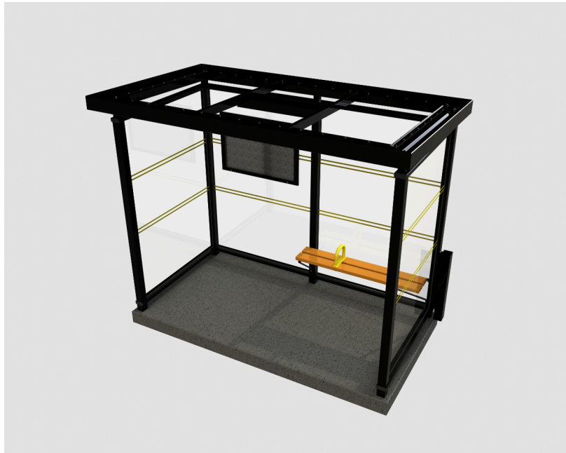
Her med transparent tak i polycarbonat

Edgy leskur er dimensjonert for å tåle vårt nordiske klima med hensyn til snø og vindlast, og er statisk beregnet i samsvar med relevante europeiske standarder.