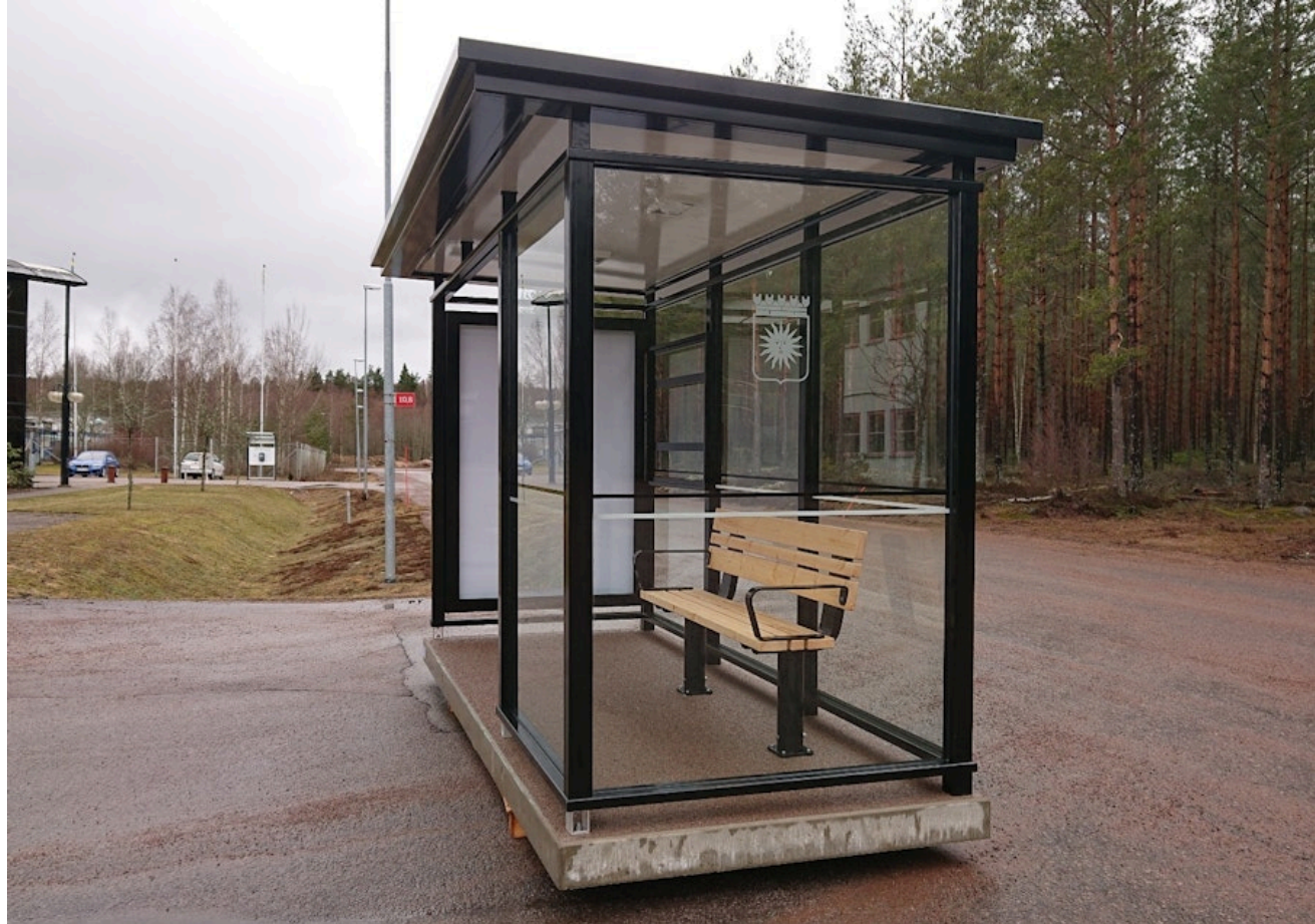
Her med tak i limpresset sandwichelement tak.

Edgy er produsert av Team Tejbrant AB, og kan leveres med pulttak (skrått) eller med flattak. Leskuret med pulttak har store glassflater som gir innsyn og utsyn, samt gjennomsynbart polykarbonat i tak. I tillegg har leskuret integrert belysning i taket som lyser opp området både utenfor og inne i leskuret. Leskurets transparente vegger og tak samt belysning er med på å gi publikum en følt trygghet når de benytter stoppestedet. En modulbasert konstruksjon muliggjør stor fleksibilitet i leskurenes lengder og dybder. Leskur Edgy kan leveres i en rekke standard utførelser, med og uten skjermvegger. Dette gjør leskuret godt egnet til bruk på alt fra små bussholdeplasser til større terminaler. Det tidløse designet gjør at leskuret passer inn i de fleste miljøer, der det på en diskret måte lar omgivelsene dominere gatebildet. Edgy kan også leveres med Sedum eller solcellepaneler på taket. Serien dekker alle krav med hensyn til universell utforming, og Statens vegvesens håndbok V129. Edgy-serien til og med 5 felt, kan leveres ferdig sammenmontert og klar for å feste på fundamentet.