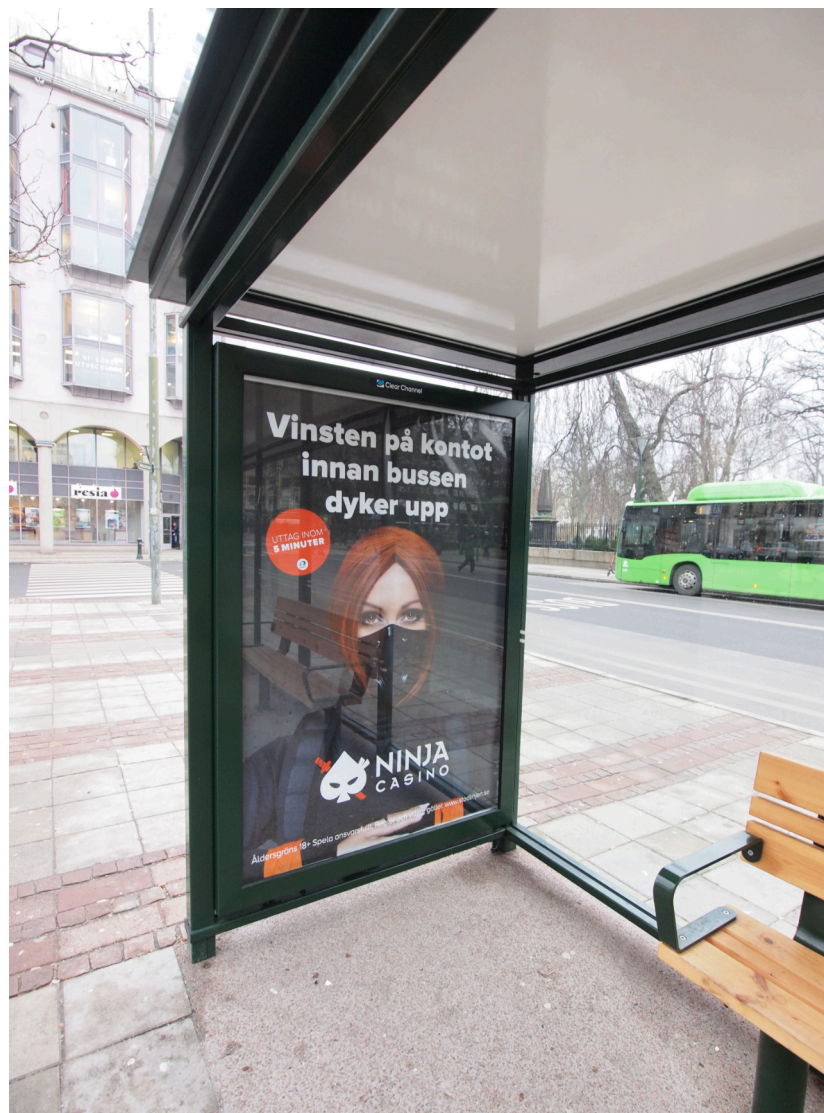
Her med tak i limpresset sandwichelement tak.